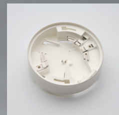
Base de anclaje al techo