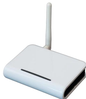
Módulo de Internet